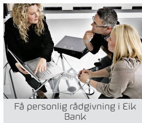
Få personlig rådgivning i Eik Bank

I Eik Bank har du mulighed for at få personlig rådgivning, selvom vi ikke har et større filialnet. I vores Rådgivningsgruppe hjælper vi dig gerne, når du står overfor store og vigtige økonomiske beslutninger såsom køb af bolig, omlægning af lån eller pensionsmuligheder. Du kan ringe direkte til vores Rådgivningsgruppe på 3389 6288, hvis du ønsker hjælp til større økonomiske beslutninger.